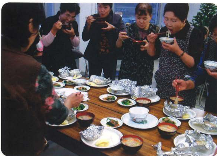
調理実習後の試食タイム (沼田圏域介護予防サポーター中級研修)

は最大の人材です。自分たちの老後をどう元気に自立して過ごしていくかについて自身で考え、動くことが介護予防なのです」と語ります。「中級コースは、支える側として予防活動に参加し、地域貢献していける人材を育てることを目的としています。その意味でも、市町村が自らの地域の介護予防事業をどう展開し、介護予防サポーターに何をしてもらいたいのかというプラン