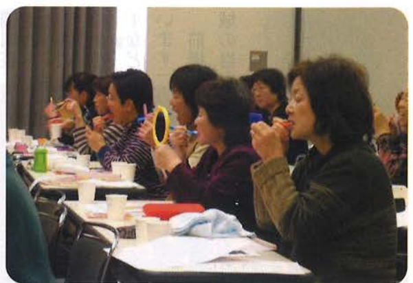
「口腔ケア」実習 (渋川圏域介護予防サポーター中級研修)