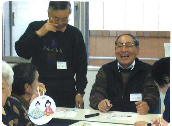
市主催の介護予防教室でお手伝いをしながら介護予防サポーターの上級者をめざす（前橋市）

を明確にした上で事業を実施することが重要です。したがって、初・中級カリキュラムについても、市町村のニーズに応じて『ちょっと』変えてよいことにしています。」と受講者、市町村が踏まえるべきポイントを示しています。 サポーターが自主的に 介護予防サークルを立ち上げ