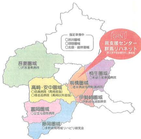
図2 群馬県の地域リハビリテーション支援センター